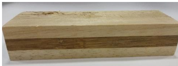
Gambar 2. Kombinasi kayu kemiri (face dan back) dan bambu petung (core)