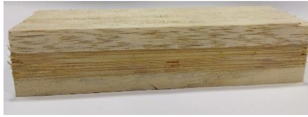
Gambar 3. Kombinasi kayu rajumas (face dan back) dan bambu petung (core)